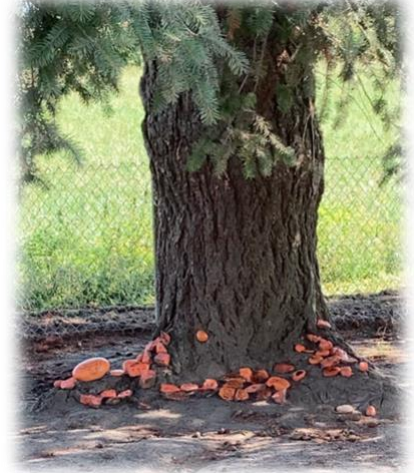
VISITE D'OZZY CHEZ MME KATIA