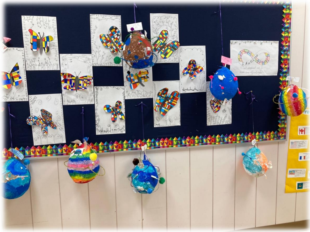
ON S'AMUSE DEHORS