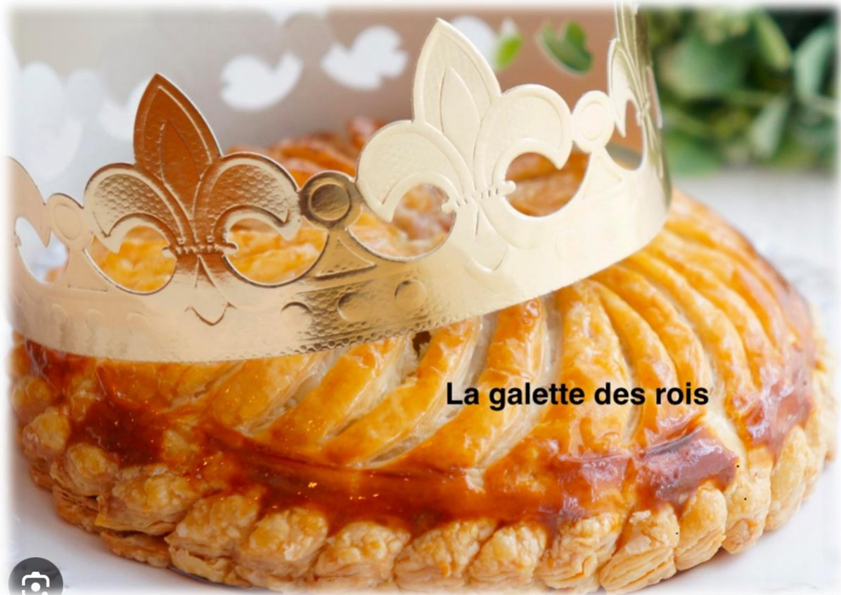
La galette des rois